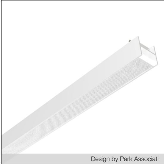
Design by Park Associati