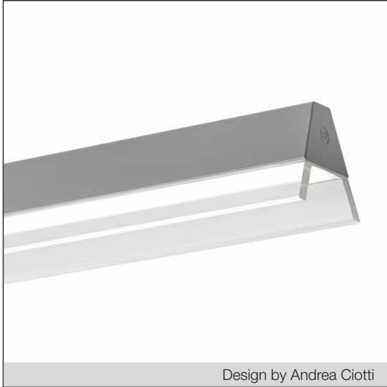
Design by Andrea Ciotti